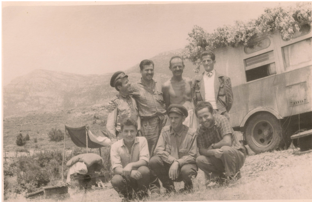
Eksperimentimi i metodës së Polarizimit të Provokuar në Vlahnë, 1962