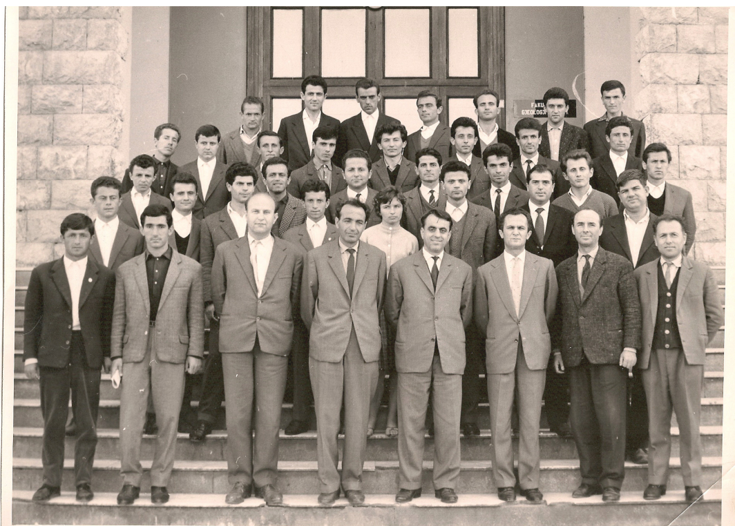
Me studentët e viteve gjashtëdhjetë