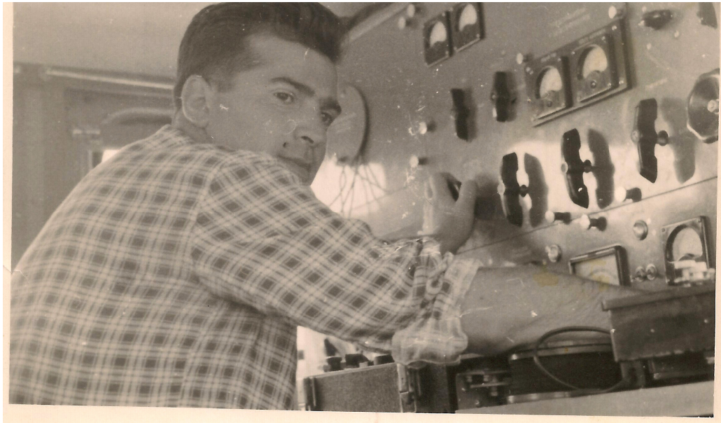
Eksperimentimi i metodës së Polarizimit të Provokuar në Kam Tropojë, 1962