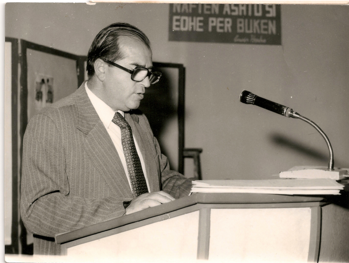
Për shtetet, nafta dhe gazi janë të nevojshme si buka. Pa bukë e pa naftë nuk ka pavarësi!