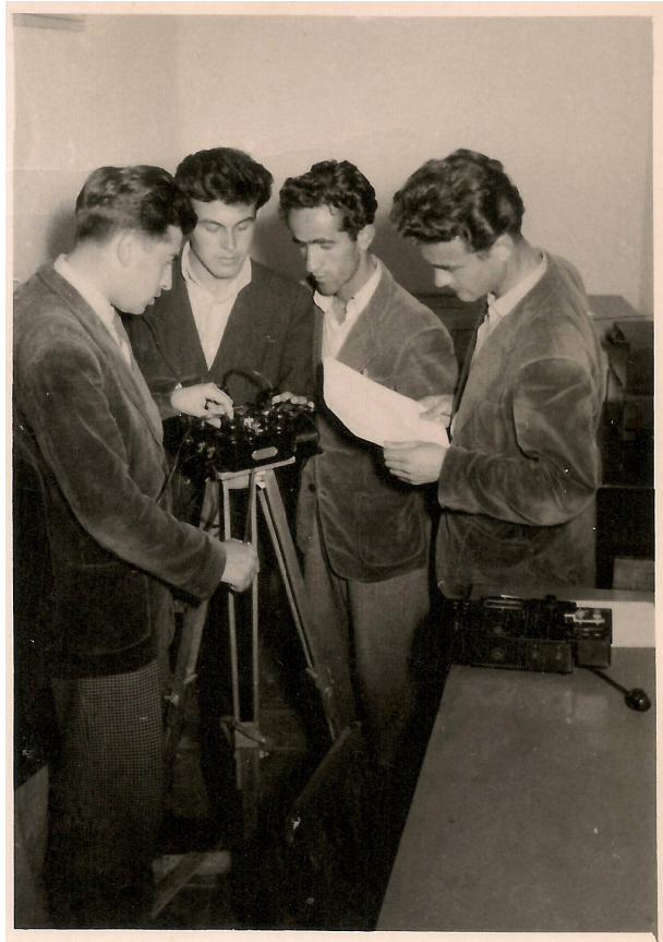
Laboratori Gjeofizikës, 1959.